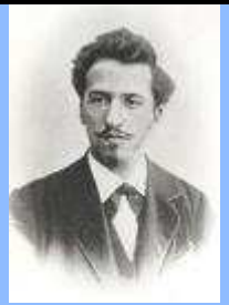
Piet Mondrian ( 1872-1944) : peintre néerlandais.

L'artiste met en œuvre des lignes noires traversant le tableau horizontalement et verticalement. Ces lignes forment une grille irrégulière contenant des zones de couleurs ( noir, rouge...).